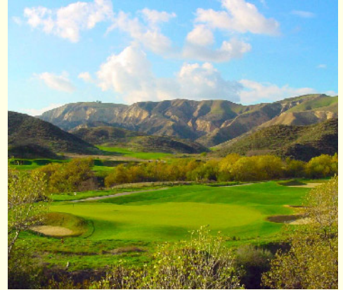
ロストキャニオンGC