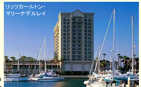
マリナーを見渡す5エーカーの敷地内に建つ5つ星ホテル