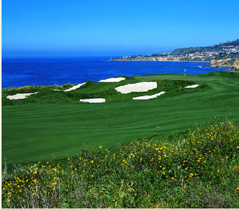
トランプナショナルゴルフクラブ