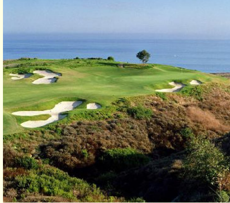
ペリカンヒルゴルフクラブ