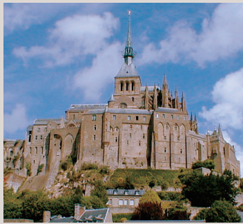
モンサンミッシェル