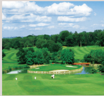
パリインターナショナルGC