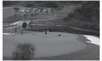
重慶保利ゴルフクラブ(重慶)