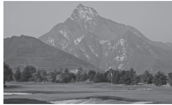
亜建国際ゴルフクラブ(西安)