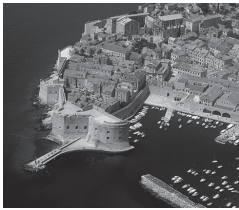
アドリア海の真珠ドブロヴニク(クロアチア)