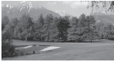
ゴルフ&カントリークラブ・ブレッド(スロヴェニア)