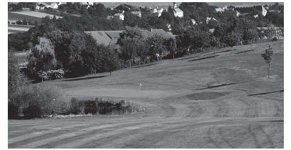
ゴルフリゾート・バード・グリースバッハ