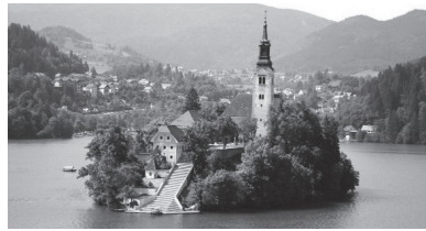
ブレッド湖(スロヴェニア)