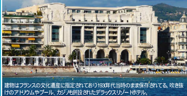
パレド・ラ・メディテラネ (ニース)

建物はフランスの文化遺産に指定されており1930年代当時のまま保存されてる。吹き抜けのアドリアムやプール、カジノ併設されたデラックスリゾートホテル。