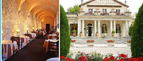
ジュール・セザール (アルル)

世界遺産の町・アルルの中心に建つ宮殿風デラックスホテル。館内は重厚なアンティーク家具が並び、客室も歴史を感じられる調度品が置かれ趣がある。